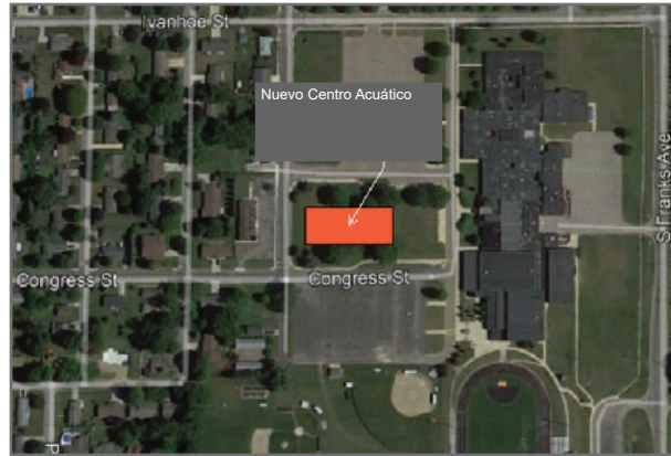
NUEVO CENTRO ACUÁTICO