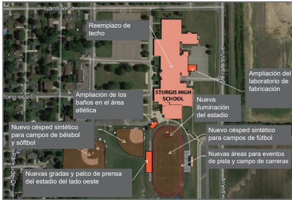
ESCUELA SECUNDARIA STURGIS