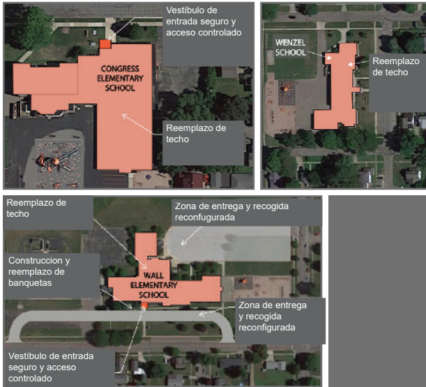
CONGRESS | WALL | WENZEL